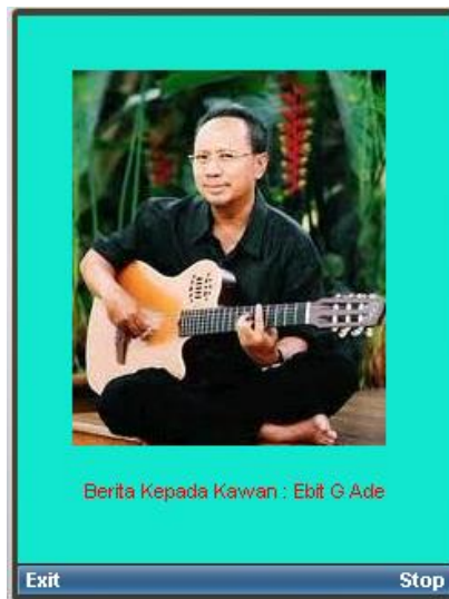
Pilih 4: Ebit G ADE MP3