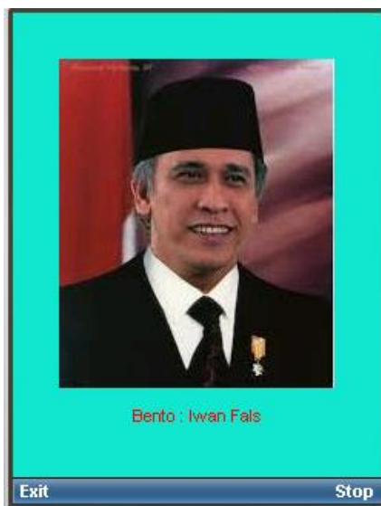
Pilih 5: Bento MP3