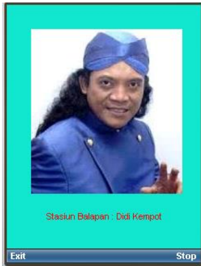
Pilih 3 : Didi Kempot MP3